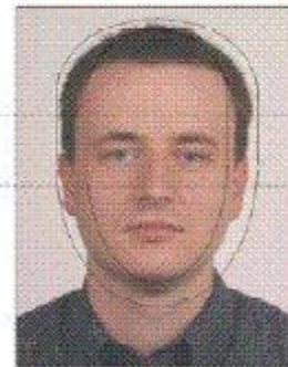
Příklad fotografie / Контрольный шаблон

Nos musí být na středu / Линия носа располагается по центру фотографии